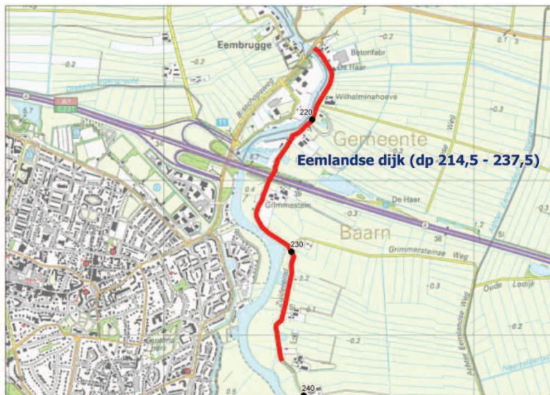
Figuur 5.30 Locatie deeltraject Eemlandse Dijk