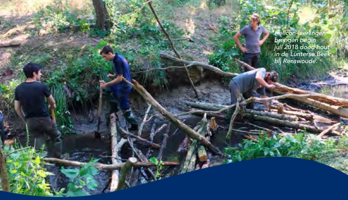
Melicon-leerlingen brengen begin juli 2018 dood hout in de Lunterse Beek bij Renswoude.