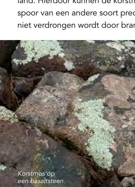
Korstmoss op een basaltsteen.

Oorzaak is het zout uit de Zuiderzeetijd. Door de andere begroeiing zoals brandnetels en gras te verwijderen, creëren de vrijwilligers ruimte. Dat doen ze met voegenkrabbers, kniebeschermers en handschoenen, geleverd door Stichting Landschapsbeheer Gelderland. Hierdoor kunnen de korstmossen zich uitbreiden. En wie weet waait er eens een spoor van een andere soort precies op deze plek, zodat die daar ook kan groeien en niet verdrongen wordt door brandnetels.